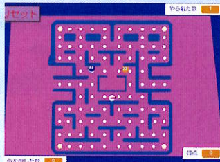
「妖怪は悪夢に舞う」