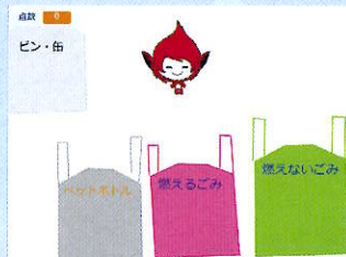
「目指せ分別マスター!」