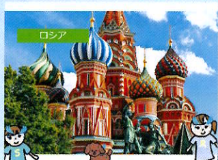
「みんなと一緒に楽しくVRメガネで世界旅行」