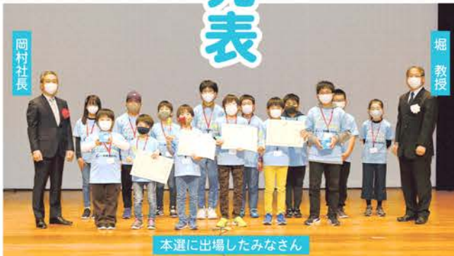
本選に出場したみなさん

オリジナルキャラクターぐるぐるくんが出題する図形の問題に答えるアプリは、ぐるぐるくんの底知れない魅力を感じた。プログラミングを使って学びを深められないかという思いが感じ取れた。